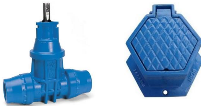
Illustration af en stopventil (stikledningsventil) og dæksel

Såfremt det er en nedgravet stopventil, skal der bruges en T-nøgle for at lukke/åbne for ventilen – vandværket har et par stykker og kan lånes hos formanden. Ventilen sidder typisk i 100 – 120 cm dybde og er monteret med en spindel, der ender i blåt hængslet dæksel. Dækslet sidder ofte fast og skal 'hjælpes' med f.eks. en stor skruetrækker. Når T-nøglen er påsat toppen af spindlen, skal der typisk drejes 15-20 omdrejninger højre om før ventilen er lukket. Husk at teste at ventilen er lukket ved at åbne for en vandhane i huset. Vandstrømmen skulle gerne ophøre indenfor et kort tidsrum. Luk vandhanen i huset og åben for stopventilen igen – dvs. 15-20 omdrejninger venstre om og så lige 2 omdrejninger højre om. Det sidste for at forhindre at spindlen 'sætter' sig i yderstilling. Efter afprøvning, vil vandet kortvarigt være misfarvet indtil at stopventilen og rørene er gennemskyllet.