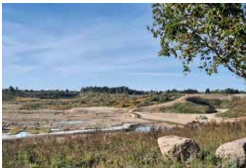
FællesHEDEN, det 'nye' område af Hedeland

I daglig tale kendes området som Grusgraven og ligger ud til Tranemo-sevej og Brandhøjgaardsvej. Det 42 hektar – svarende til cirka 42 fodboldbaner - store område bruges normalt kun af mountainbikeryttere og hundeluftere på grund af dets stejle skrænter og våde jordbund. Men under Spejdernes Lejr 2022 bliver området forvandlet til et aktivitetsmekka med sjove og anderledes aktiviteter, der ud-