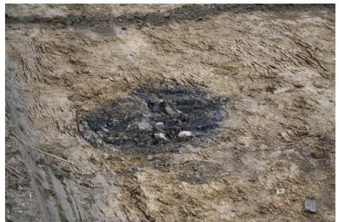
Bålplads fra vikingetiden