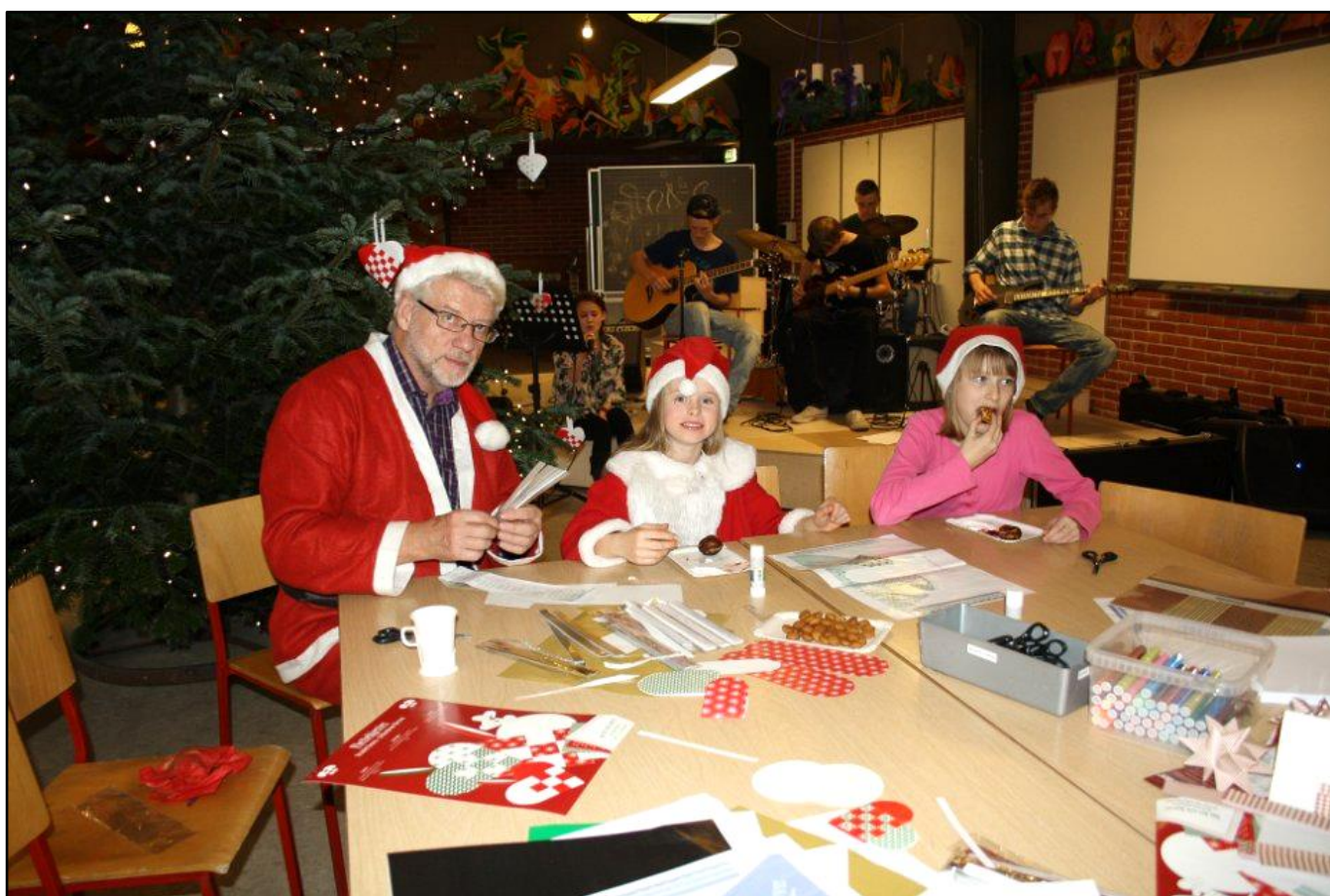
Julemandens værksted, 2013

"Tingstedet" ønsker alle en glædelig jul og et godt nytår