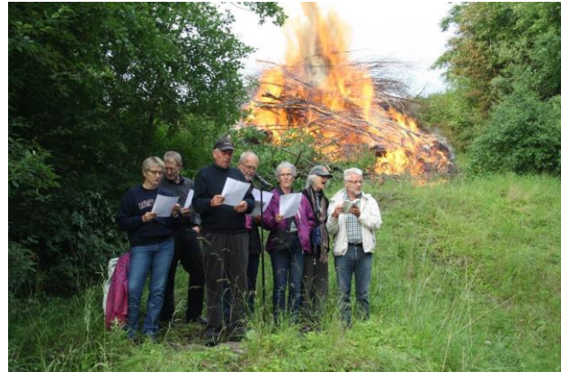
Billeder fra Skt. Hans Aften 2013.

VEL MØDT TIL EN FESTLIG OG HYGGELIG AFTEN