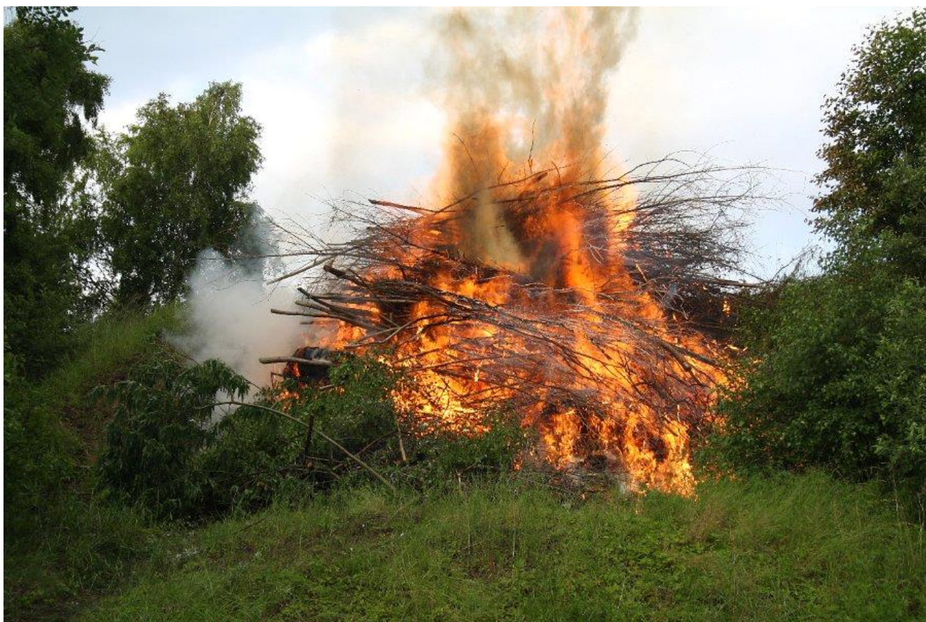
Midsommer – Skt. Hans bål i Lergraven

Lokalblad for Reerslev og Stærkende Sogn