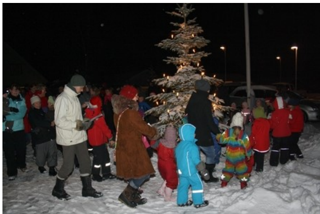
Nisseorkesteret spiller op til dans foran Reerslev forsamlingshus.

Landsbylauget vil gerne være med til at ryste borgerne sammen i vores landsbyer. Derfor afholder vi hvert år mange forskellige arrangementer, hvor alle er velkomne. Alle arrangementer annonceres i Tingstedet og på vores hjemmeside www.reerslev-sterkende.dk samt husstandsomdeles.